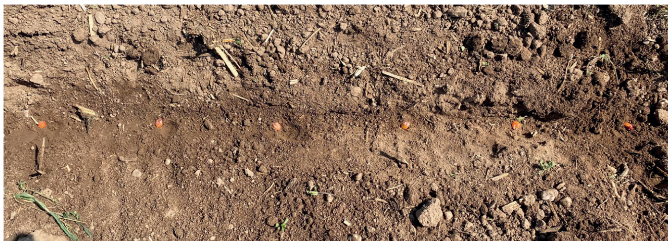
Fig. 7 : Grains de maïs déterrés de la variété Es Traveler semés à une vitesse de travail de 16 km/h