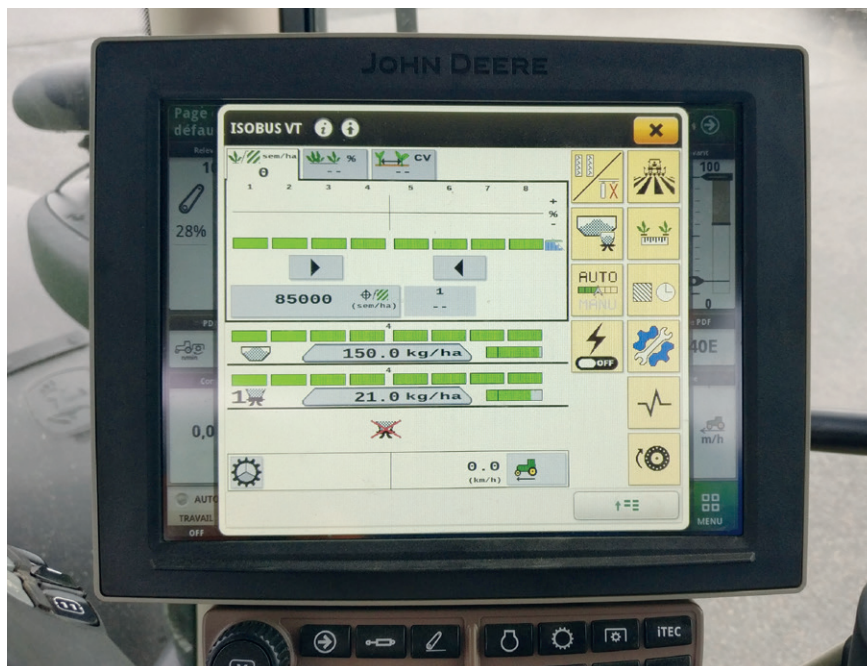
Fig. 3 : terminal de commande utilisé John Deere 4640

En règle générale, lors du semis, la vitesse de travail du système distributeur est automatiquement adaptée à la vitesse d'avancement du tracteur.