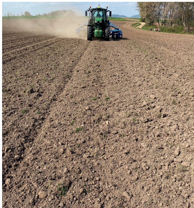
Fig. 6 : Etat du lit de semences pendant le semis de maïs

Lors de l'évaluation de la distance entre les plants le 16 mai 2022, 45 manques ont fait l'objet d'une recherche de graines sur le champ d'essai. Ces 45 cas de manque étaient répartis uniformément dans les 9 variantes de semis. Une graine correctement déposée a été trouvée dans 37 des 45 cas de manques (82 %). Elles ont donc